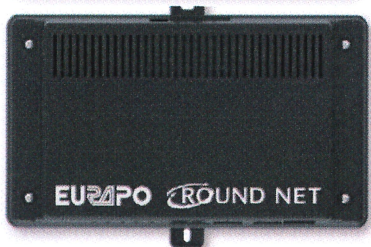
Round Net - ORS9 xxxxxxxxxxxx

Sono conformi alla pertinente Direttiva dell'Unione: Direttiva 2014/53/UE DEL PARLAMENTO EUROPEO E DEL CONSIGLIO del 16 aprile 2014 concernente l'armonizzazione delle legislazioni degli Stati membri relative alla messa a disposizione sul mercato di apparecchiature radio e che abroga la direttiva 1999/5/CE Secondo le seguenti norme armonizzate (ove applicabili):