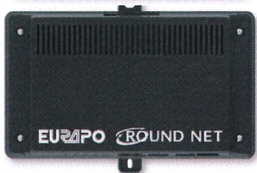
Round Net - ORS9 xxxxxxxxxxx

comply with provisions of the following European Directive: