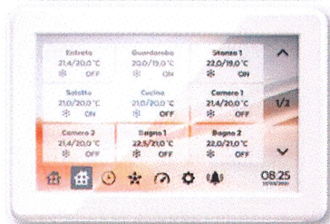
Round Master - ORS8 xxxxxxxxxxxx