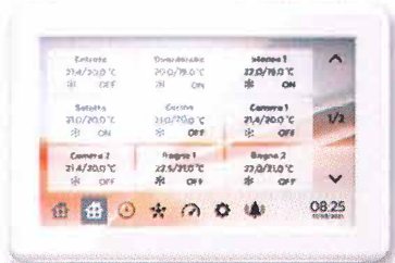
Round Master - ORS8 xxxxxxxxxxx