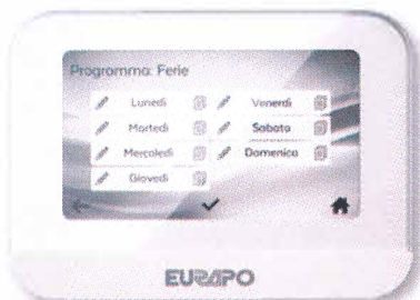
Round Manager - ORS7xxxxxxxx

Round Manager - ORS7xxxxxxxx, Round Master - ORS8 xxxxxxxxxxx e Round Net - ORS940 xxxxxxxxxxx,